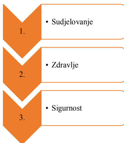
Shema 4. Komponente za aktivno starenje i kvalitetu života starijih osoba

Godine 2002. Svjetska zdravstvena organizacija (WHO) postavila je tri komponente za aktivno starenje i kvalitetu života starijih osoba, komponente su prikazane na Shemi 4.