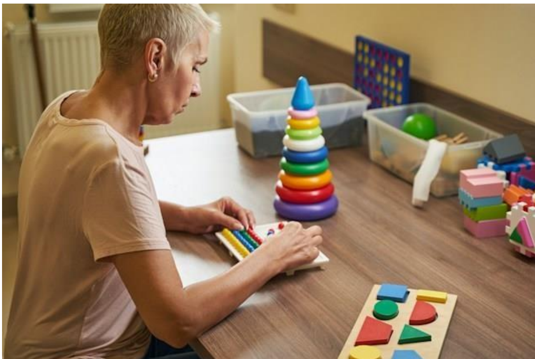
Slika 2. Radna terapija za unapređenje kognitivnih sposobnosti kod starijih osoba

Radna terapija za unapređenje kognitivnih sposobnosti kod starijih osoba je prikazana na Slici 2.