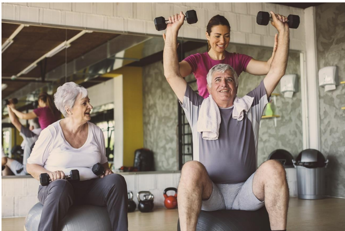
Slika 1. Vježbe za starije osobe

Vježbe za starije osobe su prikazane na Slici 1.