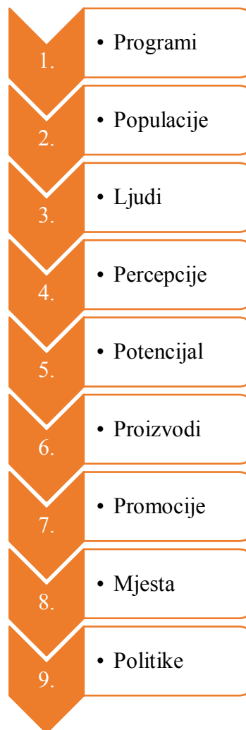
Shema 2. Devet principa aktivnog starenja

Devet principa aktivnog starenja su prikazani na Shemi 2.