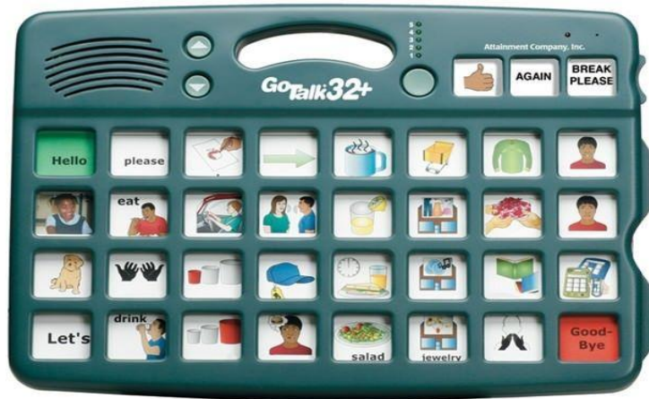
Slika 2. Komunikator