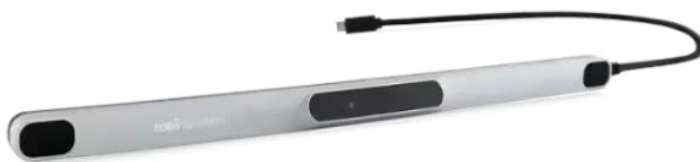
Slika 4. PCEYE go

Tobii PCEYE go je maleni uređaj poput USB-a koji se može priključiti na računalo. Njegova najveća prednost je što ima funkciju da korisnik pomicanjem (praćenjem pogleda) oka može raditi željene aktivnosti na računalu i tako uspostaviti komunikaciju. Osobe s ALS-om, ozljedom leđne moždine, cerebralnom paralizom i drugim dijagnozama koje utječu na motoričke aktivnosti imaju jako veliku korist od navedenog uređaja. PCEYE go uređaj je dovoljno malen i lagan te se lako prenosi i koristi na računalima ili tabletima unutar različitih okruženja poput škole i posla (29).