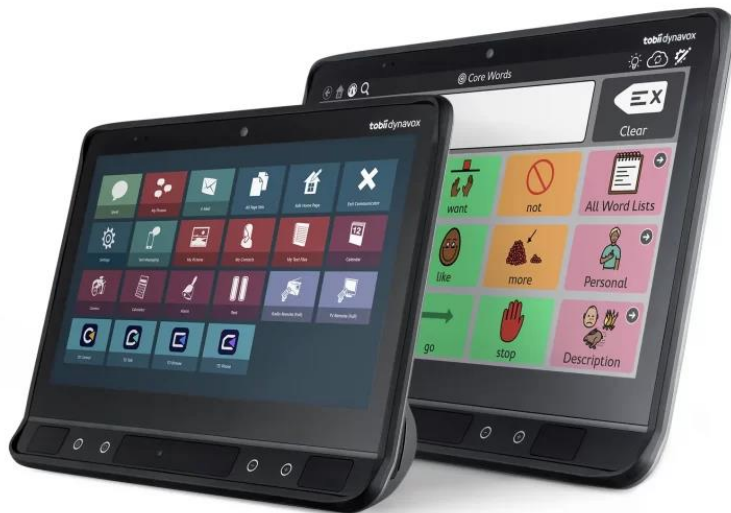
Slika 3. Tobii komunikator